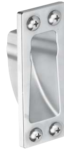
片開き用ストライク SKB型